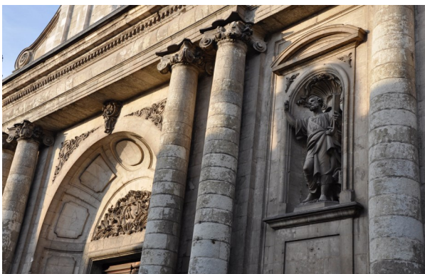
Église Saint-André.